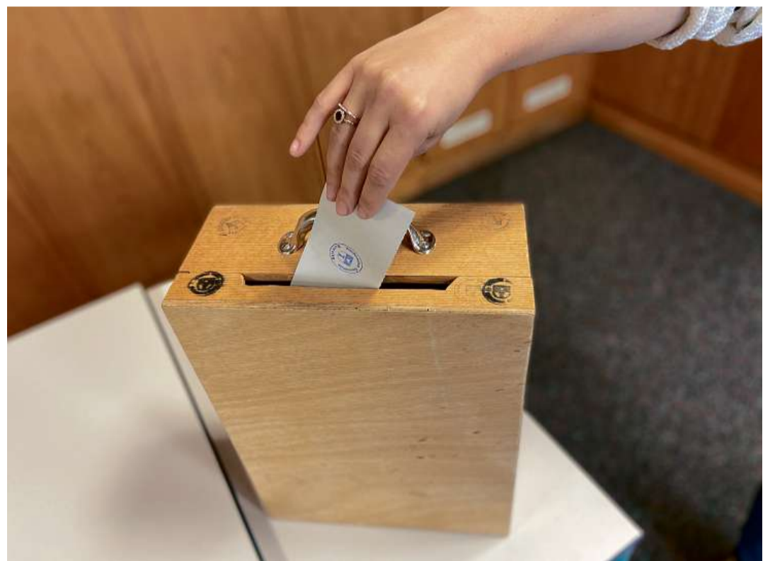
Sistem electoral sco cumbat da pussanza per il mandats en il Cussegl grond.