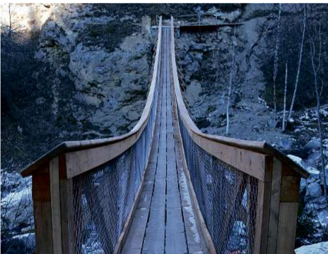
Semegliontamein savess la punt pendenta a Mumpé Medel veser ora.